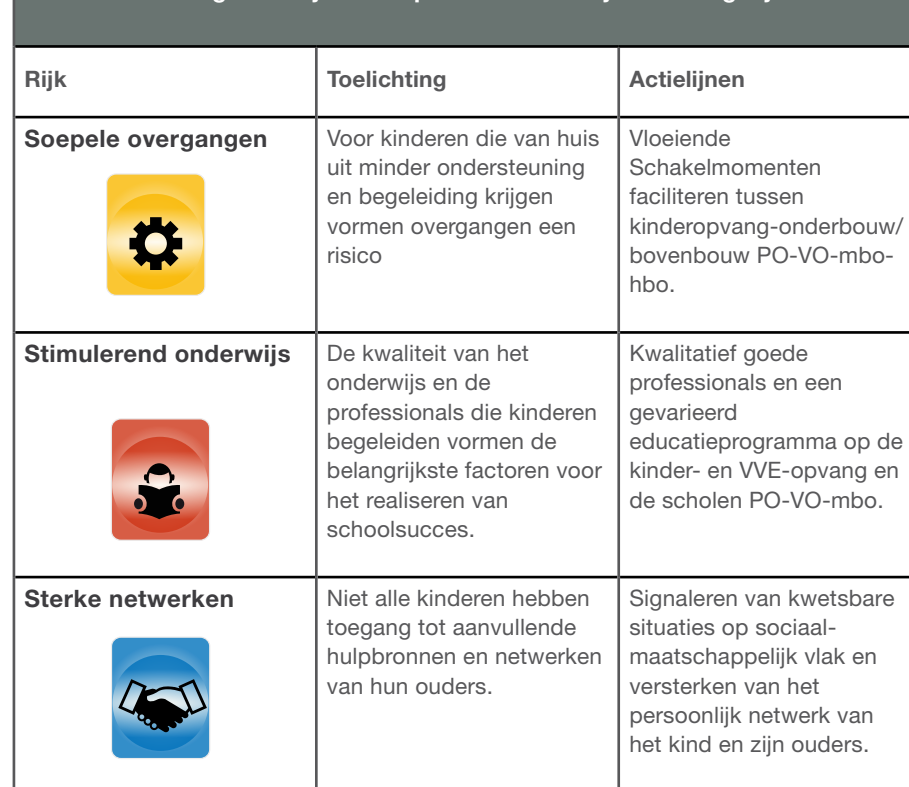
Tabel 1: Vertaling landelijke actieplan naar actielijnen voor gelijke kansen